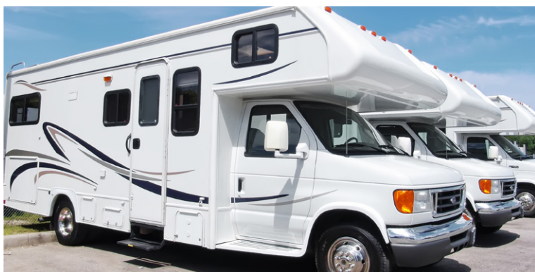
Camping-car à capucine.

Idéal pour les voyages à deux, le profilé est la « famille » préférée des camping-caristes français. C'est le véhicule le plus vendu actuellement. Il bat des records de ventes, et devient le numéro un, tant en neuf qu'en occasion, passant ainsi devant les capucines. Le profilé est bien souvent un camping-car deux places. Il possède un lit permanent à l'arrière du véhicule, soit dans le sens de la longueur, soit transversal, lui permettant d'avoir des côtes plus généreuses. Son salon se trouve à l'avant autour d'une dînette entière, ou d'une demi-dînette, et les fauteuils de cabine deviennent dès lors, en pivotant, des fauteuils de salon. Ce type de véhicule de loisirs est généralement utilisé en couple. Moins haut et moins imposant qu'une capucine, il permet en outre un rangement plus important, notamment avec sa soute située sous le lit permanent, permettant d'amener avec soi un grand nombre d'objets qui ne trouveraient pas forcément leur place ailleurs. Les profilés les plus standard ont une longueur de 6 mètres, une largeur de 2,30 m et une hau-