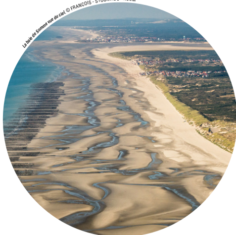
La baie de Somme vue du ciel