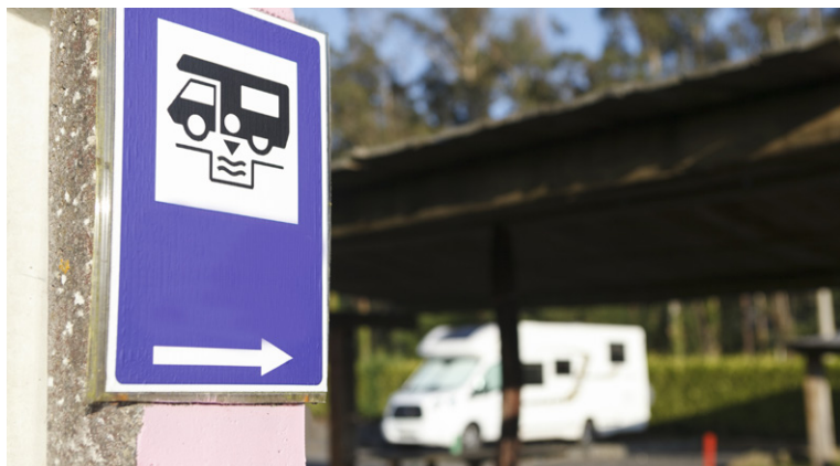
Aire de services où l'on peut vider les eaux usées.

Le propane, qui supporte des températures de -40°C, a progressivement remplacé le butane. Si vous partez en été, une bouteille de 13 kg dure plus d'un mois. Mais attention à l'hiver et au chauffage : comptez une durée de vie de 2 à 6 jours pour la même bouteille de 13 kg ! Vous pouvez opter pour des bouteilles de 5 kg, plus faciles à manier, mais d'une autonomie beaucoup plus réduite, comme vous vous en serez douté.