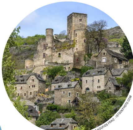
Le village de Belcastel